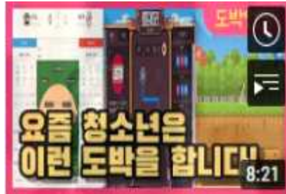
아이들은 어쩌다 도박에 빠지게 된 걸까?