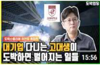
대기업 다니던 명문대생이 도박하면 벌어지는 일들